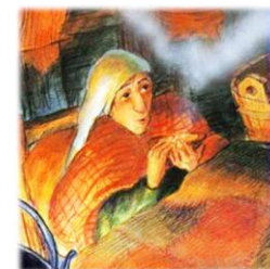
مرد تعمیر کار

بیخشید که مزاحم شدم. از پدر و مادرت شنیده‌ام که تنها هستی و دوستی نداری. فکر کردم شاید این مرغ همبازی خوبی برایت بشود.