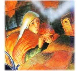
مرد تعمیر کار